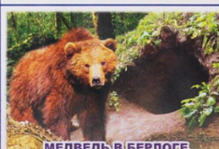
МЕДВЕДЬ В БЕРЛОГЕ