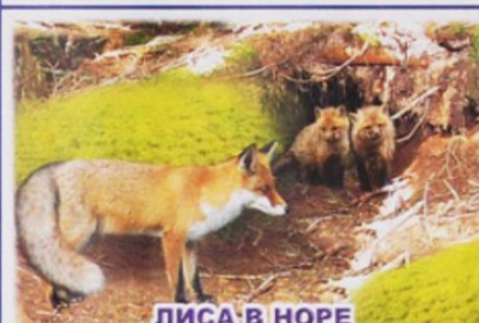
ЛИСА В НОРЕ