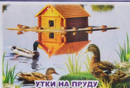
УТКИ НА ПРУДУ