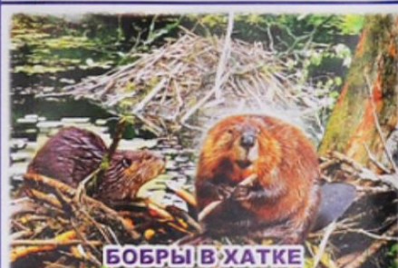
БОБРЫ В ХАТКЕ