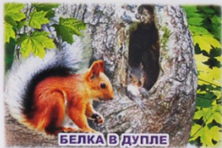
БЕЛКА В ДУПЛЕ