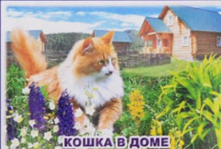
КОШКА В ДОМЕ