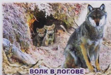
ВОЛК В ЛОГОВЕ