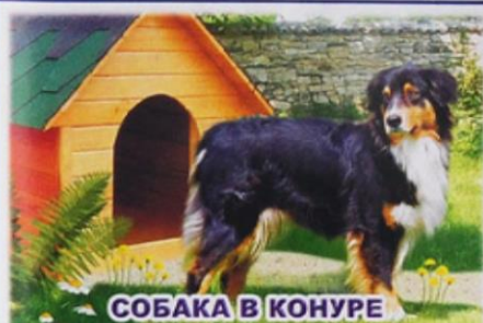
СОБАКА В КОНУРЕ