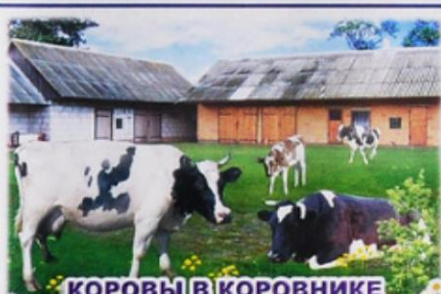
КОРОВЫ В КОРОВНИКЕ