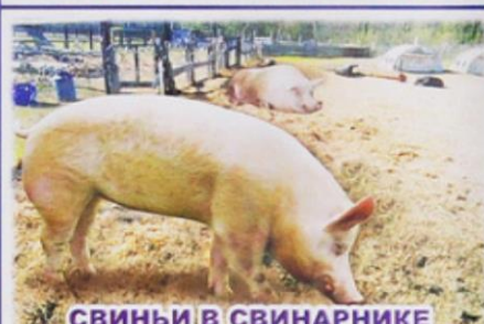
СВИНЬИ В СВИНАРНИКЕ