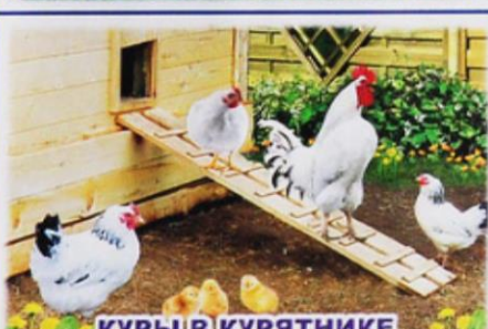
КУРЫ В КУРЯТНИКЕ