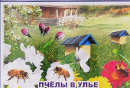
ПЧЁЛЫ В УЛЬЕ