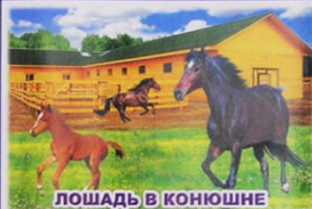
ЛОШАДЬ В КОНЮШНЕ