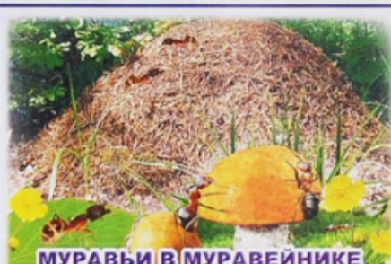
МУРАВЬИ В МУРАВЕЙНИКЕ