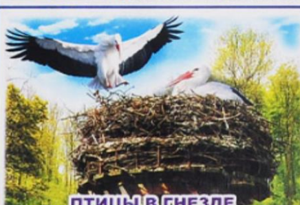
ПТИЦЫ В ГНЕЗДЕ